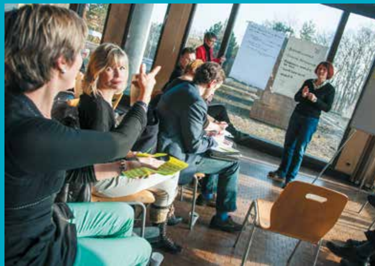
Mettre à dispositions outils et moyens pour soutenir la relation de proximité entre le Maire, l'administration et les citoyens