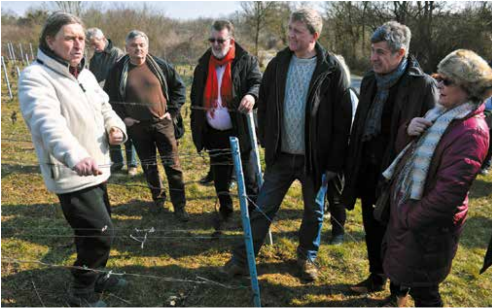
Élus, techniciens et riverains sur les côtes de Moselle à LESSY pour le périmètre de protection et de mise en valeur des espace agricoles et naturels périurbains