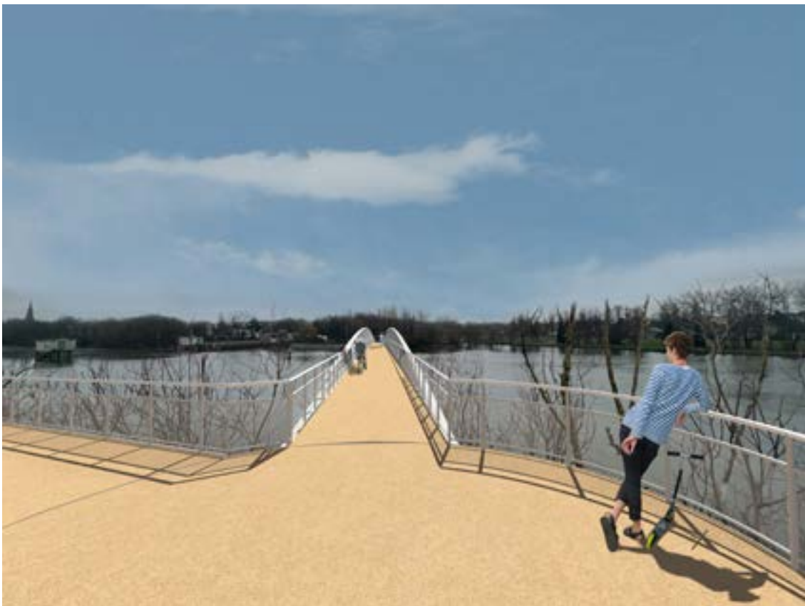
Projet de la passerelle Wadrineau