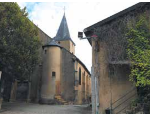
Église Saint-Rémi à Rozérielles

Agence Inspire Metz - Office de Tourisme Tél. 03 87 39 00 00 tourisme@inspire-metz.com www.tourisme-metz.com