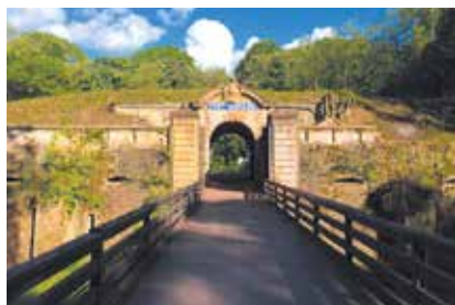
Fort de Queuleu à Metz