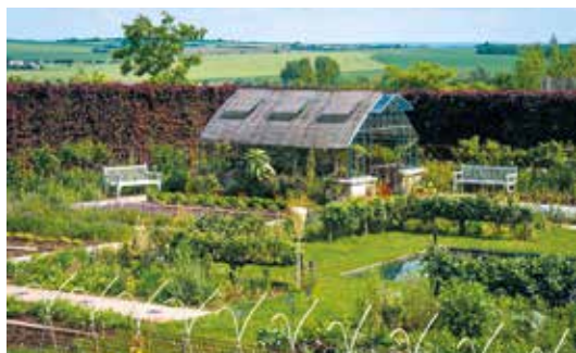
Jardins Fruitiers de Laquenexy