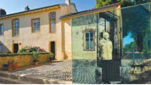
Maison de Robert Schuman à Scy-Chazelles