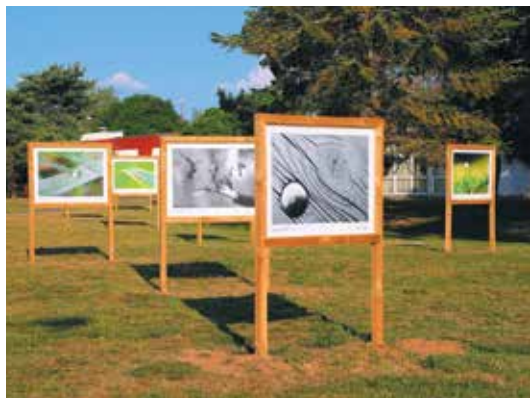
Exposition Regard Image à Marly