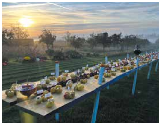
Fête des Jardins & des Saveurs à Laquenexy

Renseignements : Tél. 03 87 35 01 00 jardins-fruities@culture.moselle.fr www.moselle-culture.fr