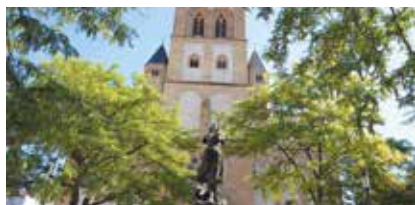
Église Saint-Joseph à Montigny-lès-Metz

Renseignements et inscriptions obligatoires jusqu'à la veille Agence Inspire Metz - Office de Tourisme : Tél. 03 87 39 00 00 tourisme@inspire-metz.com www.tourisme-metz.com