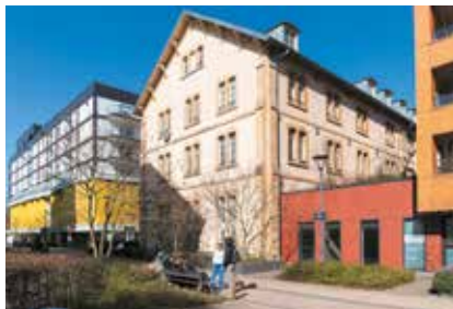
Ancienne manufacture des tabacs à Metz