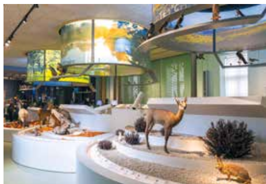
Pavillon de la Biodiversité au Musée de La Cour d'Or à Metz