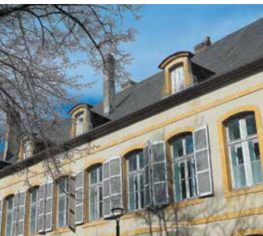
Maison Régionale de la Mémoire du Grand Est à Metz

Renseignements : Tél. 03 87 31 67 57 mediation.mrmsf@souvenir-français.fr