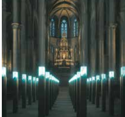
Réinterprétation des Pleurants du Duc de Bourgogne à Metz