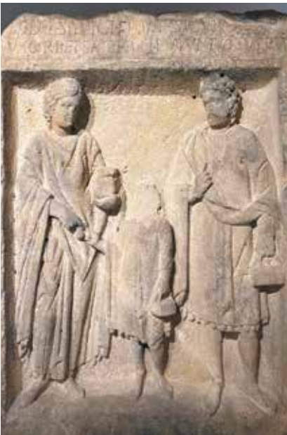
Stèle de la famille, 4 e quart II e s., Musée de La Cour d'Or à Metz

Inscription obligatoire en ligne : https://musee.eurometropolemetz.eu/