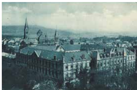
Petit séminaire vu du pont Franiatte (Privatstrasse) à Montigny-lès-Metz