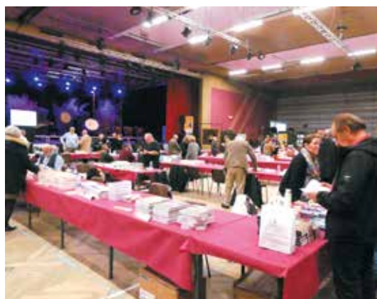
Salon du Livre d'Histoire à Woippy

Renseignements : Mairie de Woippy Tél. 03 87 34 63 00 k.biscaut@mairie-woippy.fr