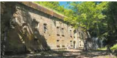
Fort Driant à Ars-sur-Moselle

Renseignements et inscriptions obligatoires au plus tard les mercredis avant les visites Tél. 06 62 73 16 71 E-mail amicalefortdriant@gmail.com https://www.facebook.com/fortdriant/