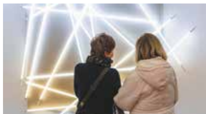
Exposition François Morellet à Metz