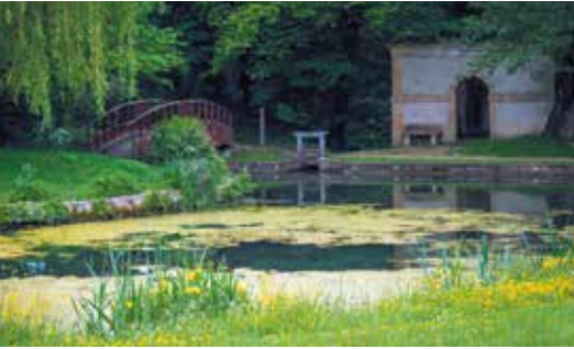
Parc Simon à Augny