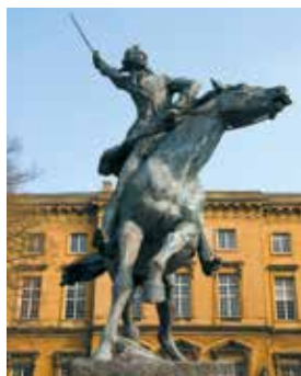
Statue équestre de La Fayette à Metz