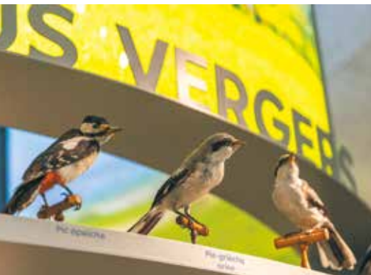
Pavillon de la Biodiversité au Musée de La Cour d'Or à Metz

Inscription obligatoire en ligne : https://musee.eurometropolemetz.eu/