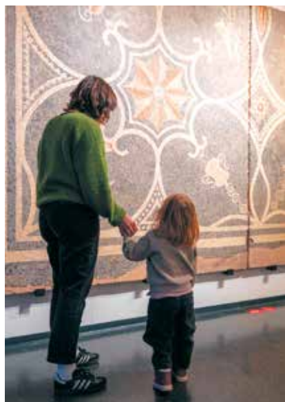
Visite À quatre pattes au Musée de La Cour d'Or à Metz

8, 10 & 22 juillet, 2 & 5 août, 6 septembre