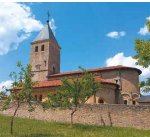
Église Sainte-Croix à Lorry-Mardigny