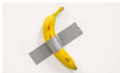
Maurizio Cattelan, Comedian, 2019