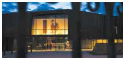
Musée de la Guerre de 1870 et de l'Annexion à Gravelotte

Renseignements et inscriptions obligatoires jusqu'au 28 octobre Tél. 03 87 33 69 40 E-mail musee.1870@culture.moselle.fr www.mosellepassion.fr