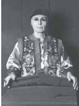
Louise Nevelson, 1976