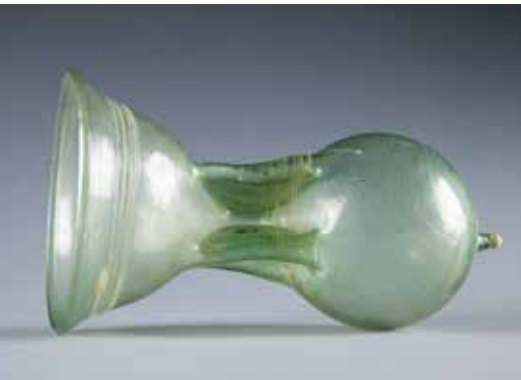
Guttrolf, VI e s., verre soufflé, Musée de La Cour d'Or à Metz