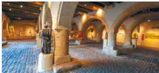
Grenier de Chèvremont, Musée de La Cour d'Or à Metz