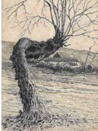
Dessin de Clément Kieffer