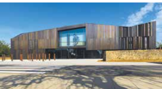
Musée de la Guerre de 1870 et de l'Annexion à Gravelotte