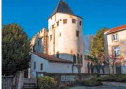
Église Saint-Quentin à Scy-Chazelles