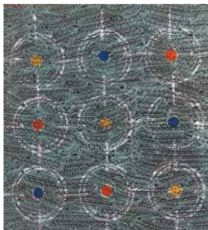
Œuvre de Philippe Serre