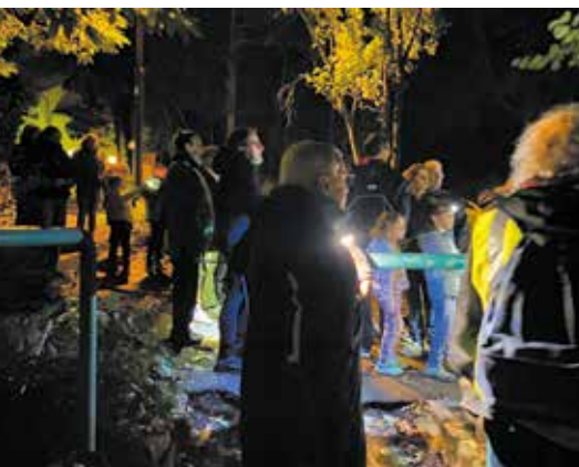
Le jour de la nuit à Plappeville

Plappeville+Verte : plappeville.plus.verte@gmail.com