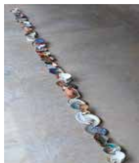
Capsules Javier Carro Tembory

Renseignements : Tél. 03 87 15 39 46 contact@centrepompidou-metz.fr www.centrepompidou-metz.fr