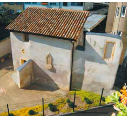
Chapelle Saint-Privat à Montigny-lès-Metz