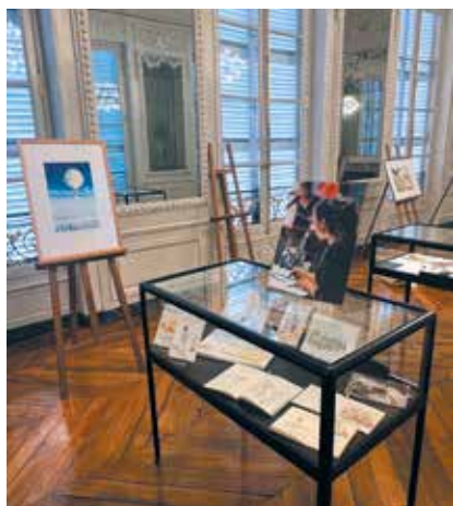
Salon Illustrateurs 2024 à Montigny-lès-Metz