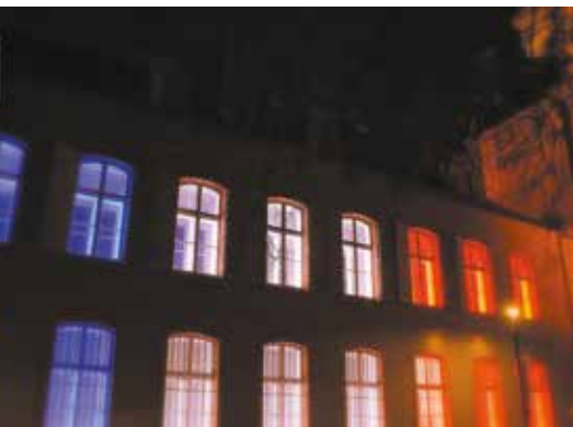
Maison Régionale de la Mémoire du Grand Est à Metz