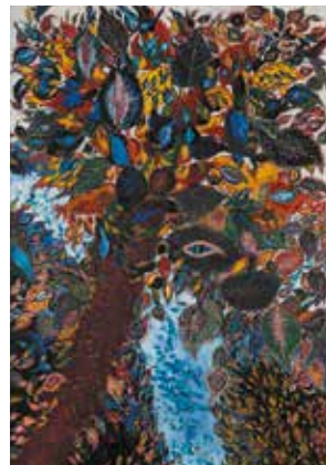
Séraphine de Senlis, L'Arbre du paradis (vers 1929 - 1930)