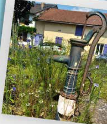
Pompes à eau, puits, ...