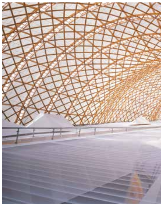
Shigeru Ban, Japan Pavilion, Expo 2000 Hannover