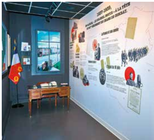
Espace muséographique de Gaulle à Montigny-lès-Metz