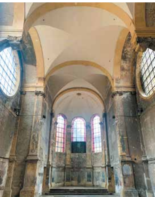
Église des Trinitaires à Metz