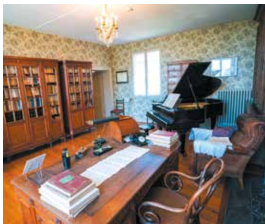
Maison de Robert Schuman à Scy-Chazelles