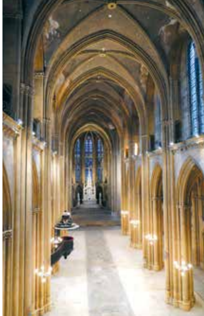
Basilique Saint-Vincent à Metz