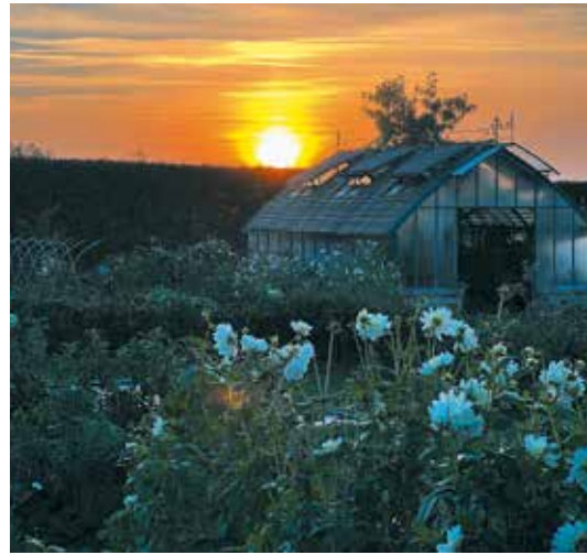
Crépuscule aux Jardins Fruitiers de Laquenexy