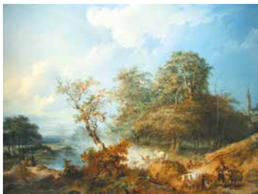
Paysage animé, Jean-Baptiste Le Prince, 1776, Musée de La Cour d'Or à Metz