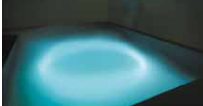
William Forsythe, Additive Inverse , 2007