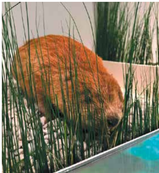
Castor, Musée de La Cour d'Or à Metz