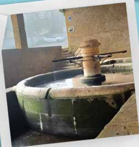
Lavoirs, fontaines, ...