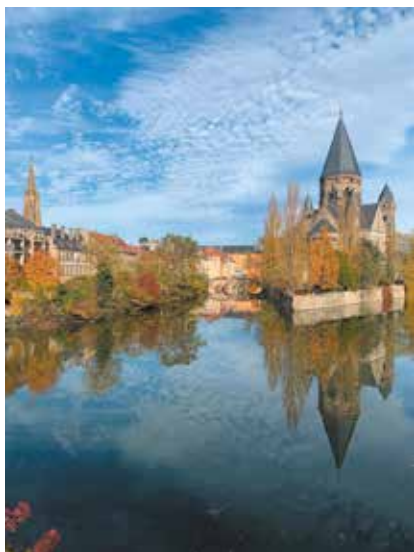
Vue sur le temple Neuf à Metz