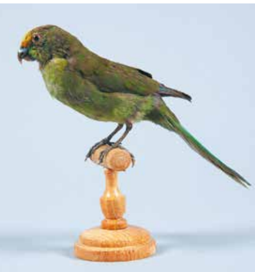
Perruche de Malherbe, Musée de La Cour d'Or à Metz

Inscriptions obligatoires en ligne : https://musee.eurometropolemetz.eu/