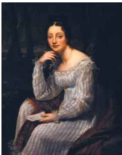
Portrait d'Amable Tastu - Musée de La Cour d'Or Euro-Métropole de Metz