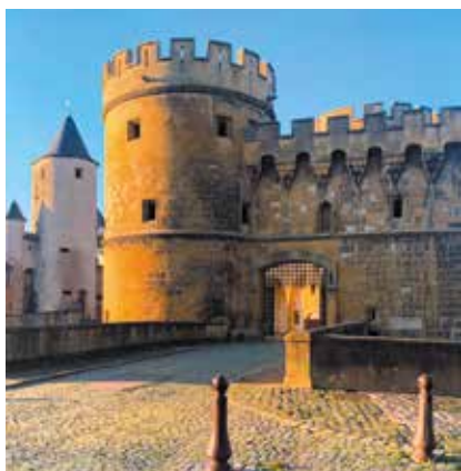
Porte des Allemands à Metz