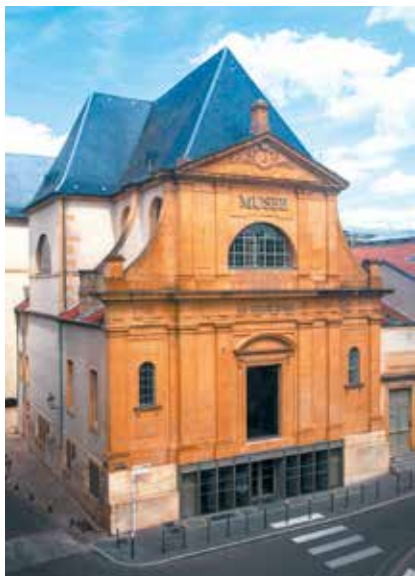
Façade du Musée de La Cour d'Or à Metz

3, 5, 6, 10, 24, 26 & 31 juillet, 9, 14, 23 & 30 août et 6 septembre