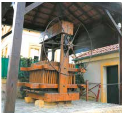
Pressoir à Sainte-Ruffine

Agence Inspire Metz - Office de Tourisme Tél. 03 87 39 00 00 tourisme@inspire-metz.com www.tourisme-metz.com