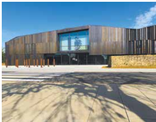
Musée de la Guerre de 1870 et de l'Annexion à Gravelotte