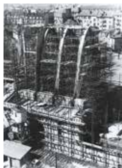
Église Sainte-Thérèse à Metz

Renseignements : Tél. 03 87 78 05 00 E-mail archives@moselle.fr www.archives57.com