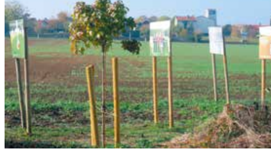
Parc aux trois nationalités à Pournoy-la-Chétive