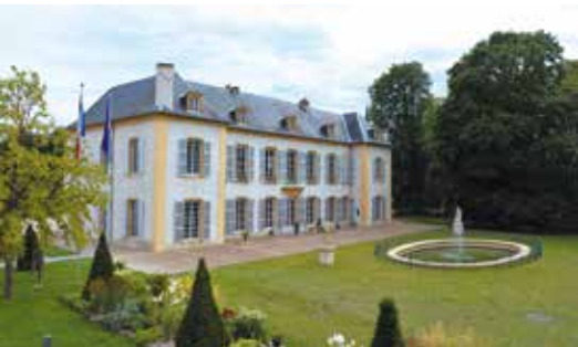
Château de Courcelles à Montigny-lès-Metz

Agence Inspire Metz - Office de Tourisme Tél. 03 87 39 00 00 tourisme@inspire-metz.com www.tourisme-metz.com