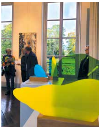
D'arts en Artisans à Montigny-lès-Metz