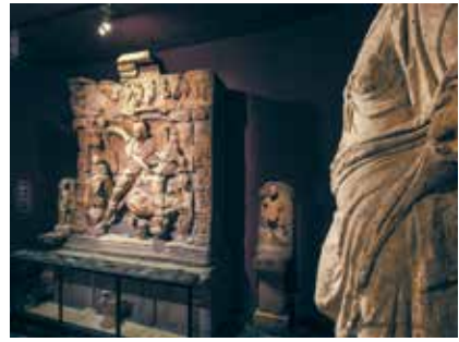
Salle Mithra, Musée de La Cour d'Or à Metz