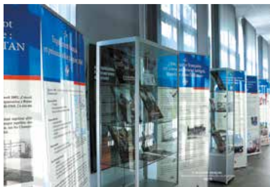
Maison Régionale de la Mémoire du Grand Est à Metz