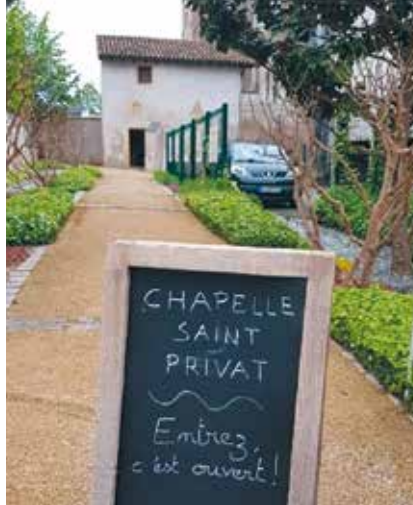
Chapelle Saint-Privat à Montigny-lès-Metz