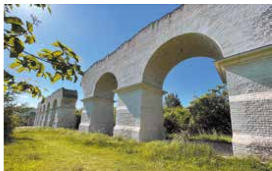
Aqueduc romain à Ars-sur-Moselle