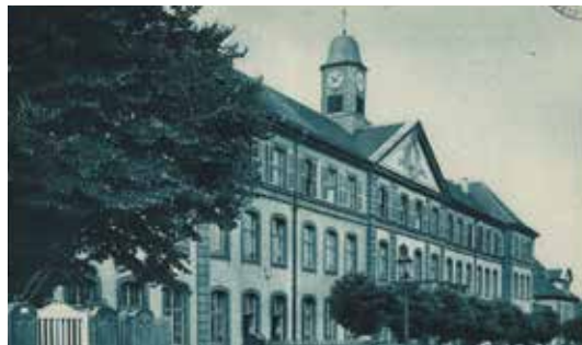
INSPÉ autrefois à Montigny-lès-Metz