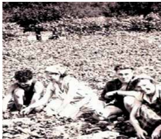
Cueillette de fraises à Woippy