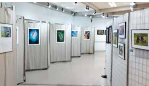
Exposition annuelle Regard Image Marly