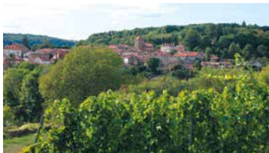
Village de Lessy