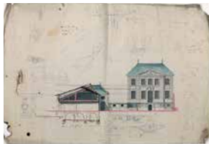
Château de Lorry-lès-Metz