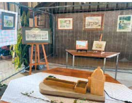
Exposition à la ferme de la Vignotte à Vany

Renseignements : Tél. 06 63 87 16 27 vivreavany@gmail.com