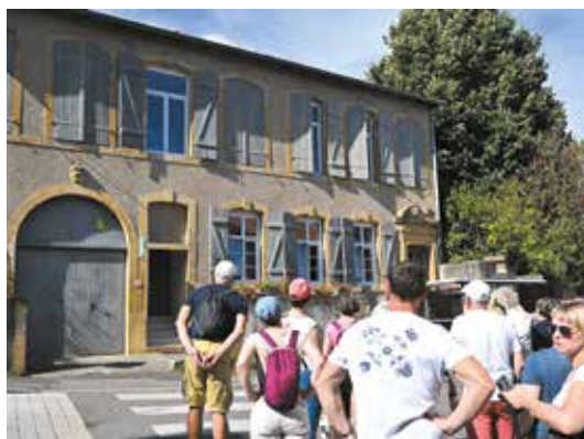
Journées européennes du patrimoine à Plappeville