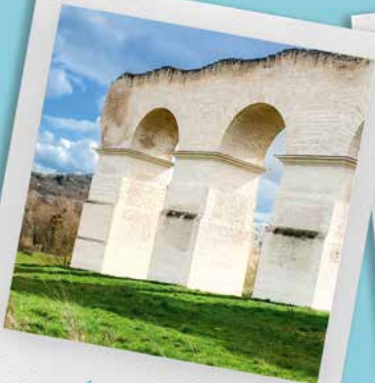
Aqueducs, ponts, ...