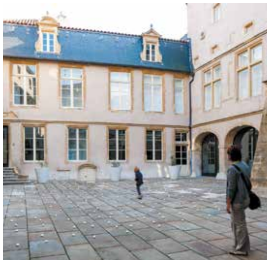
49 Nord 6 Est - FRAC Lorraine à Metz