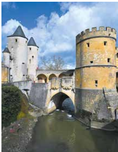
Porte des Allemands à Metz