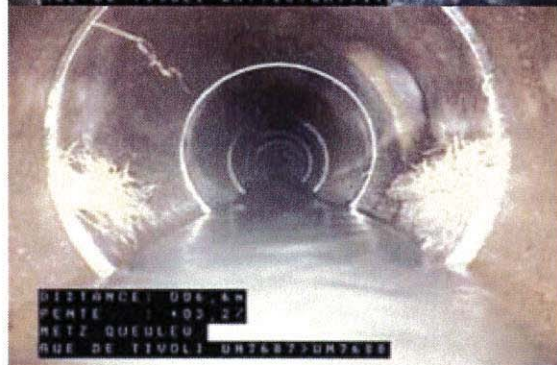
Racines et fissures