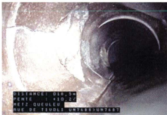
Mauvais état général et fissures