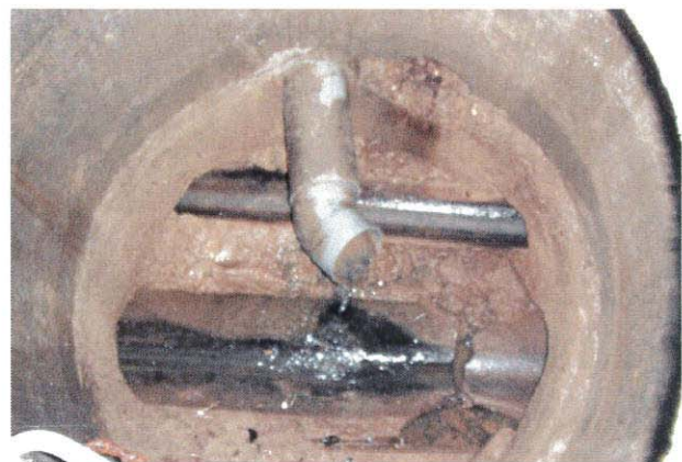
Photographies des regards doubles