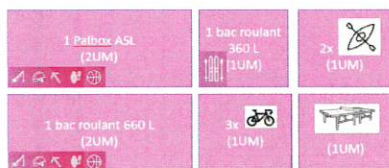
Exemple d'enlèvement de 8 UM

De façon préférentielle, les enlèvements sont réalisés sur une base hebdomadaire, ajustable à la hausse ou à la baisse en fonction des volumes déclarés dans le système d'information, et avec un minimum de 400 kg ou de 8 unités de manutention.