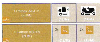
Exemple d'enlèvement de 8 UM

De façon préférentielle, les enlèvements sont réalisés sur une base hebdomadaire, ajustable à la hausse ou à la baisse en fonction des volumes déclarés dans le système d'information, et avec un minimum de 400 kg ou de 8 unités de manutention.