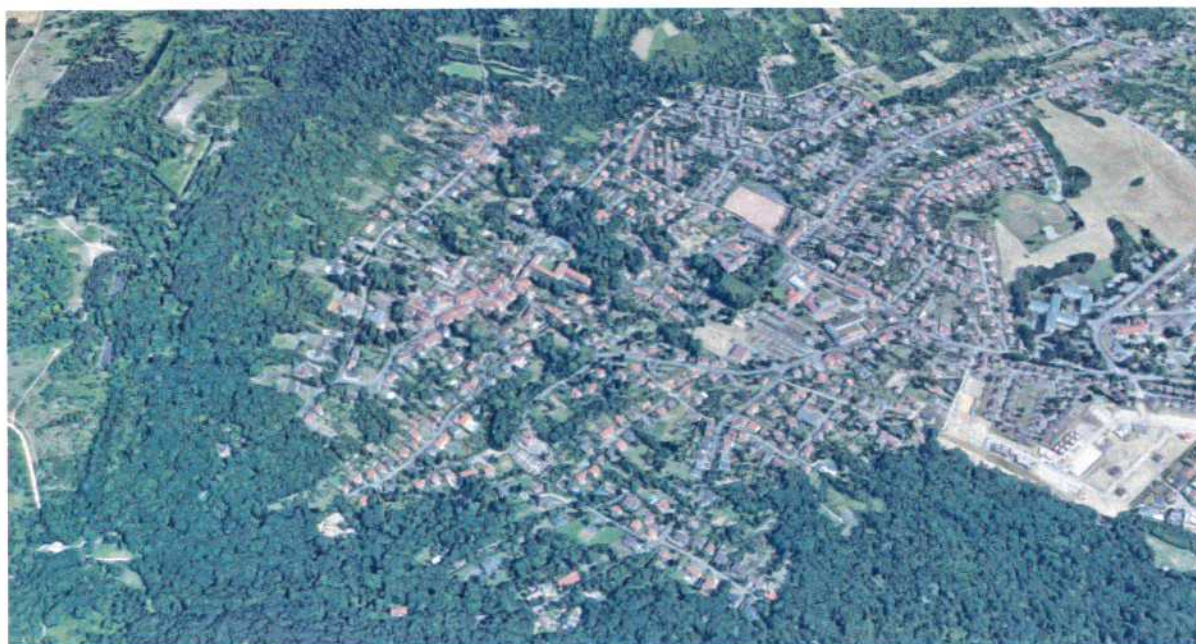
Vue aérienne de la commune, source : GoogleMaps

Cette expérience pourra être mise à profit des autres sites ouverts à l'urbanisation pour s'inspirer des principes développés et orienter les réflexions sur l'intégration architecturale, environnementale, paysagère ou même l'implantation des constructions dans toute la commune.