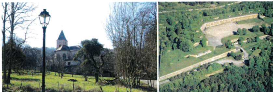
Eglise Sainte-Brigid sur son promontoire / Site de l'ancien fort militaire de Plappeville

Les secteurs ouverts à l'urbanisation respecteront les prescriptions du PPRmt. Les autres risques naturels, en particulier liés aux ruissèlements des eaux pluviales ou des eaux de surface, seront intégrés à la réflexion sur les nouveaux secteurs urbanisables (gestion de l'imperméabilisation des sols).