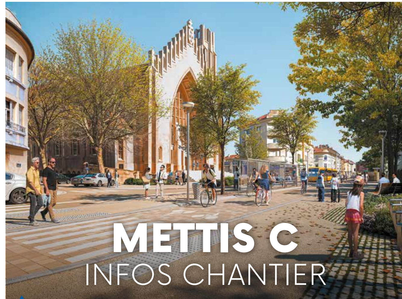
Le futur aménagement Mettis C devant l'église Sainte-Jeanne-d'Arc à Montigny-lès-Metz.

La ligne Mettis C progresse. Après les chantiers marliens et messins, l'axe Metz/Montigny/Marly entre en piste. Aménagements urbains et paysagers, stations de bus et voies cyclables : les travaux programmés à partir du mois de mai sont à suivre au quotidien sur l'appli Citykomi.