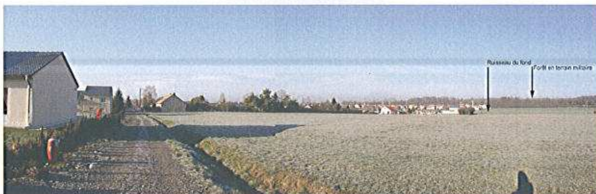
Limite entre urbanisation et pâturage

Il s'agit aussi de donner un but aux différents cheminements piétonniers, de les faire aboutir à une zone équipée de loisirs s'appuyant sur les potentialités du paysage. La retranscription du projet dans le zonage du PLU s'exprime par la création d'une Ue le long du ruisseau du fond.