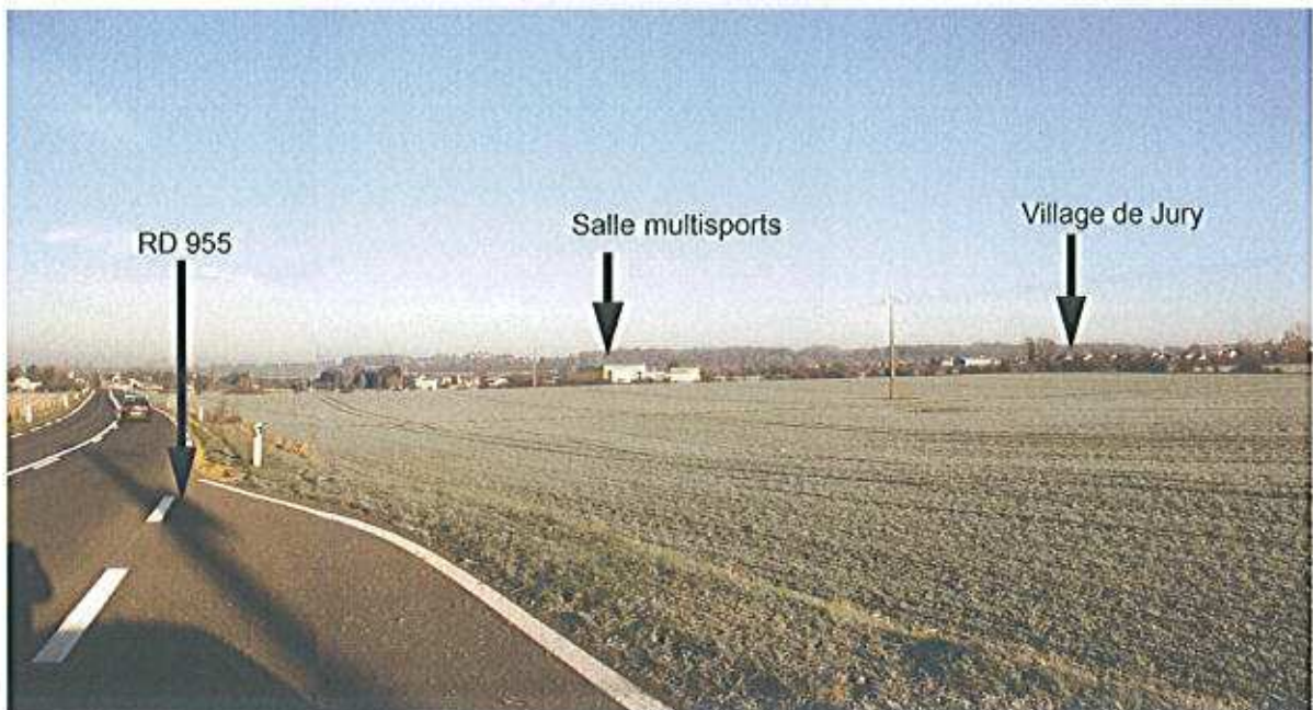
Vue de l'espace destiné à recevoir des activités

L'objectif est de permettre l'implantation d'entreprises. En effet, la situation de la commune, aux portes de Metz et en bordure d'une de ses pénétrantes, est une position stratégique qui assure l'effet de vitrine recherché par les entreprises ainsi qu'une desserte aisée.