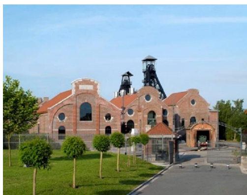
Bois du Cazier à Marcinelles - Belgique

La cité des électriciens, à Bruay-la-Bussière, représente une opération de réhabilitation des bâtiments existants. Ce type de projet conserve l'histoire et l'organisation du site, le rapport entre le bâti et les espaces libres. Au-delà de la qualité urbaine, architecturale et environnementale, il permet également d'imaginer l'organisation et la vie du site au temps de l'activité industrielle.