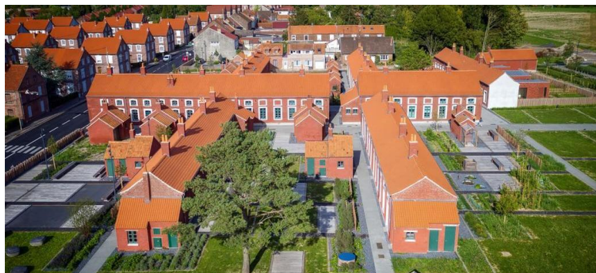
Réhabilitation de la Cité des électriciens à Bruay-la-Bussière (62)

La cité des électriciens, à Bruay-la-Bussière, représente une opération de réhabilitation des bâtiments existants. Ce type de projet conserve l'histoire et l'organisation du site, le rapport entre le bâti et les espaces libres. Au-delà de la qualité urbaine, architecturale et environnementale, il permet également d'imaginer l'organisation et la vie du site au temps de l'activité industrielle.