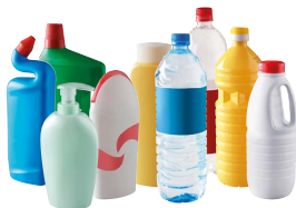
Bouteilles, bidons et flacons en plastique