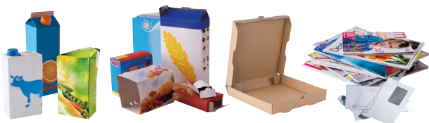
Briques alimentaires, emballages en carton et papiers