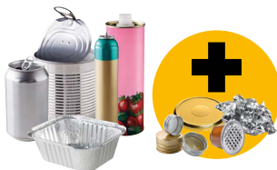
Emballages en métal