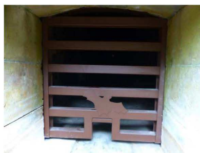
Passages pour les chiroptères